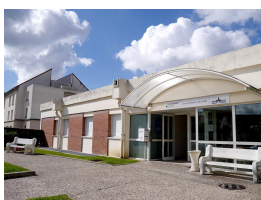
UNE MEILLEURE ACCESSIBILITE