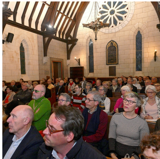
LES VENEURS 4/4