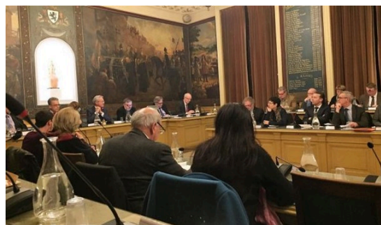
CONSEIL AGGLOMERATION - 11/04