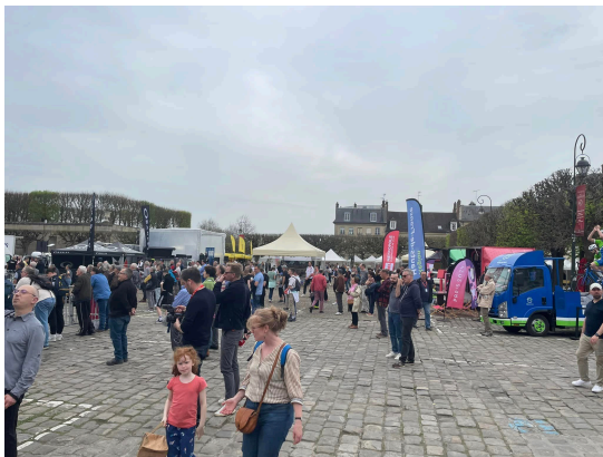
PARIS ROUBAIX - 7/4