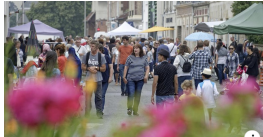
PHOTO: COMPIEGNE.fr Réunion de quartier | Site internet officiel de la ville de Compiègne et de son Agglomération (ARC).