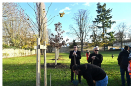
1 NAISSANCE 1 ARBRE 25/11