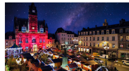
INAUGURATION MARCHÉ DE NOËL 25/11