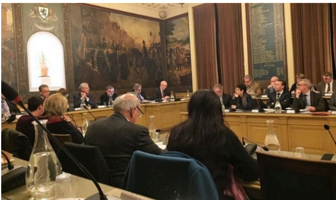
CONSEIL D'AGGLOMERATION - 11/07