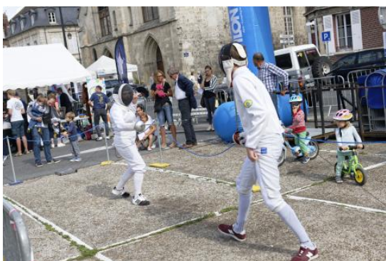
FÊTE DES ASSOCIATIONS - 14/09