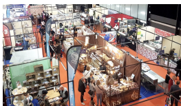
1 FOIRE EXPO DE COMPIEGNE 01/10