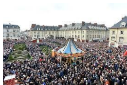
RASSEMBLEMENT REPUBLICAIN 21/10